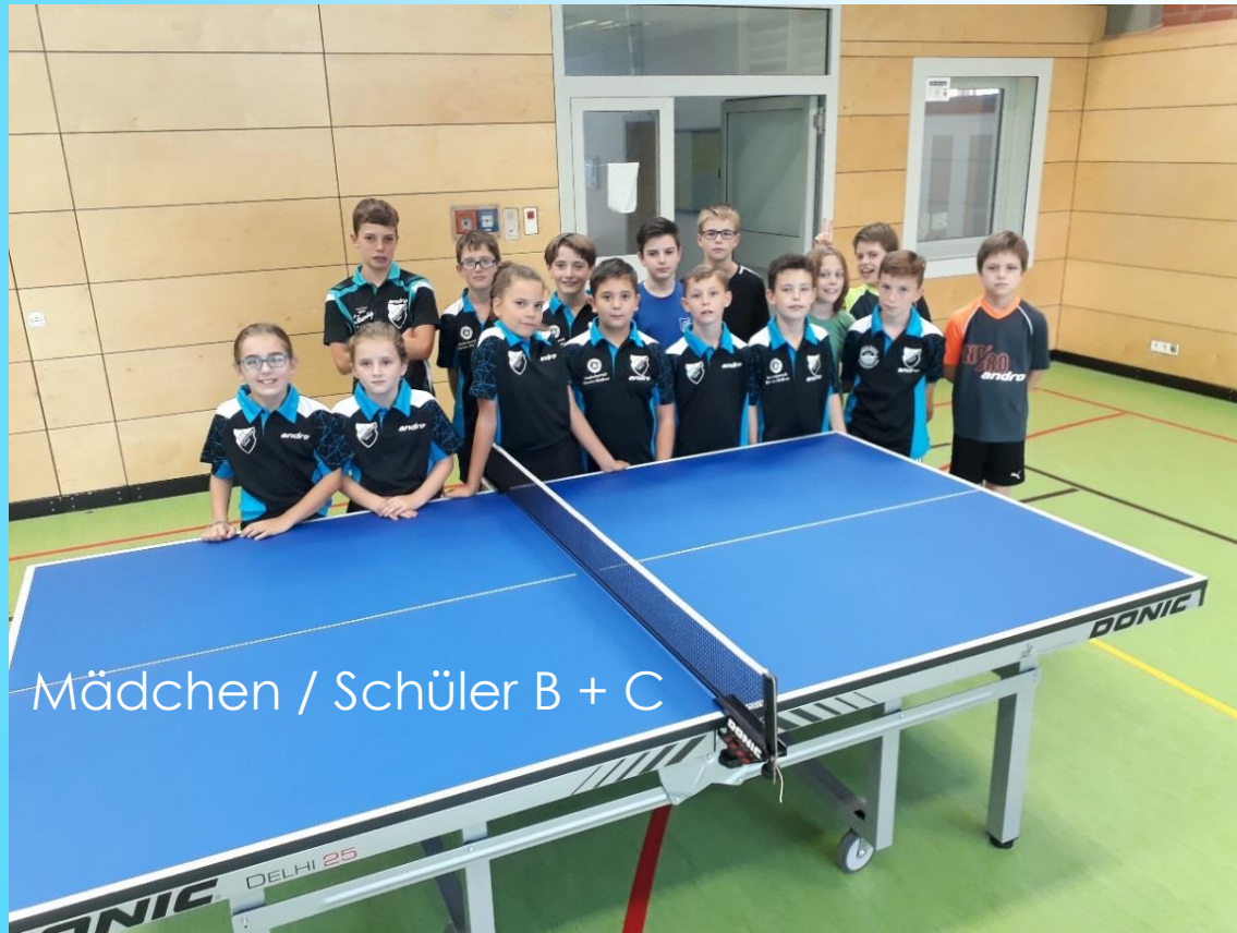
Mädchen / Schüler B + C