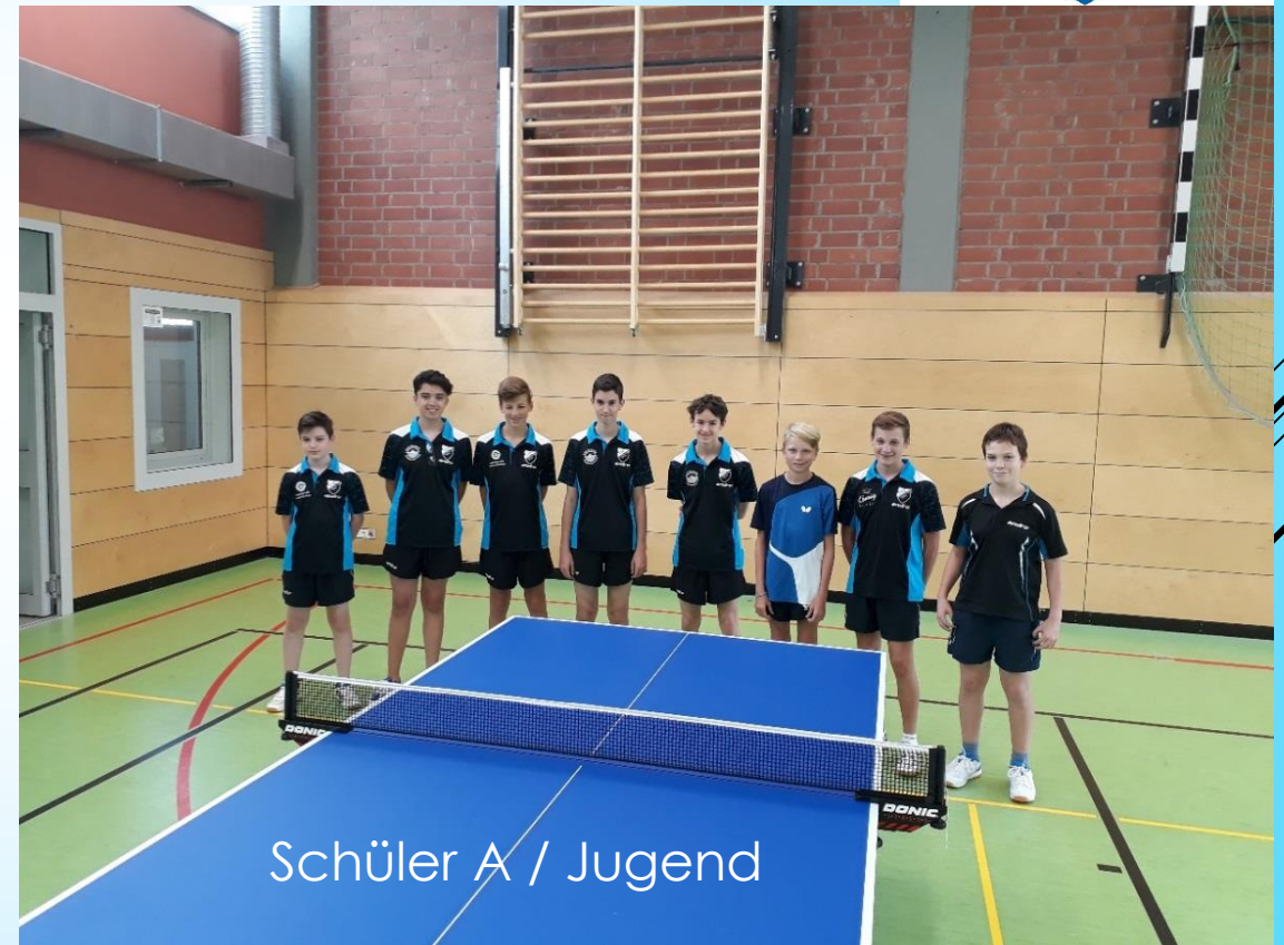
Schüler A / Jugend